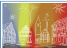
Kuppinger Weihnachtsleuchten 2020

Zum Jahresausklang dürfen sich alle Kuppinger Vereinsmitglieder und Bürger aus Kuppingen auf das "Kuppinger Weihnachtsleuchten" freuen. Highlights sind dabei der illuminierte Ortskern am 20.12. von 17 bis 22 Uhr und das Musikfeuerwerk am 26.12. um 18 Uhr. Alle Infos zum Kuppinger Weihnachtsleuchten findest Du hier .